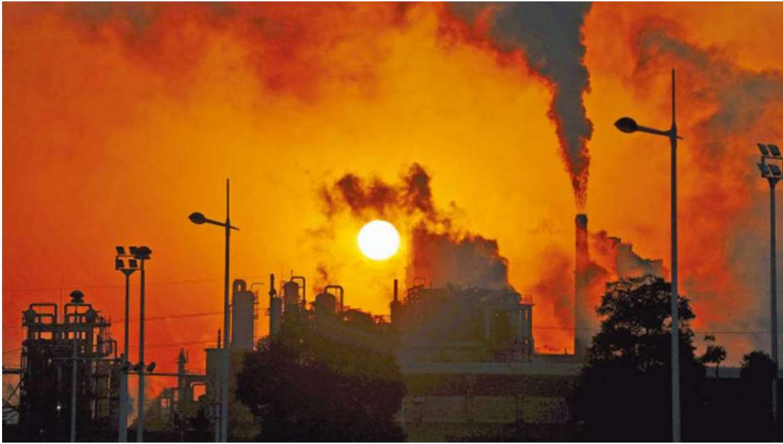
香港致力爭取於2050年前實現碳中和。